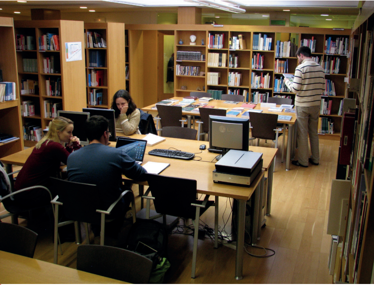
Biblioteca de l'Institut.