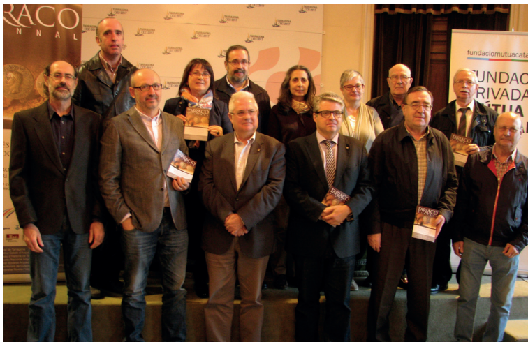
Membres del Comitè científic i representants de les institucions organitzadores del II Congrés Tarraco Biennal.

Seminari internacional Les estratègies d'ocupació dels territoris conquerits en les províncies hispanes s. II-I aC: primers assentaments de control i models d'implantació . Organitza l'ICAC. Tarragona, 30 d'octubre.