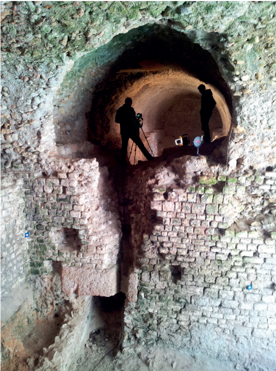
Documentació de l'interior de les voltes de la plaça dels Sedassos de Tarragona.

Paral·lelament, la UDG ha coorganitzat el curs "Làser Escàner i Multiestació en Arqueologia i Patrimoni", amb Leica-Geosystems, i el seminari "Noves tecnologies i documentació arqueològica", amb la col·laboració de Leica-Geosystems i el Col·legi d'Arquitectes de Tarragona.