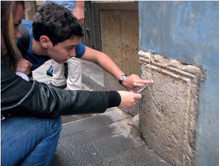
Alumnes del curs Bojos per l'Arqueologia! analitzant una inscripció.

Curs Bojos per l'Arqueologia! (2a edició del programa "Bojos per la ciència!"). Organitza la Fundació Catalunya-La Pedrera amb l'IPHES, l'ICAC i l'ICRPC, en el marc del programa SUMA. Tarragona i Girona, 18 de gener-13 de desembre.