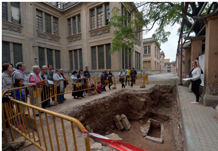
Jornada de portes obertes a la basílica paleocristiana de Sant Fructuós de Tarragona.

Jornada de portes obertes a la intervenció arqueològica a la Basílica de Sant Fructuós (Necròpolis Paleocristiana de Tarragona). Organitzen l'Arquebisbat i l'Ajuntament de Tarragona, l'ICAC i l'Autoritat Portuària de Tarragona amb la col·laboració de l'ACSF i el MNAT. Tarragona, 2 de novembre.