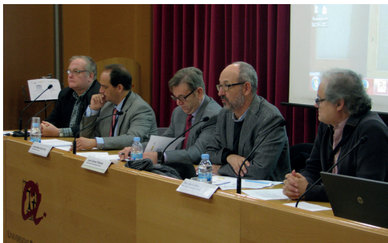
Inauguració del III Congreso Internacional de la Secah a l'Aula Magna de la URV.

III Congreso Internacional de la Secah - Ex officina Hispana Amphorae ex Hispania. Paisajes de producción y consumo . Organitzen la Secah, l'ICAC i la URV. Tarragona, 10-13 de desembre.