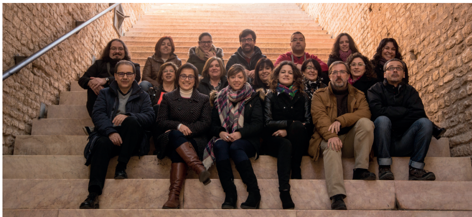
Personal de gestió i suport a la recerca a la capçalera del circ romà de Tarragona.