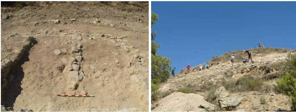
Imatges del poblat ibèric: habitació i vistes generals del vessant.

Només en teníem un coneixement superficial, fruit d'haver excavat unes habitacions. Però ara hem desbrossat una superfície important del vessant SO i hem vist que és una zona d'ocupació més extensa del que crèiem. No hi ha una mera extensió del poblat més antic! Hi ha mínim cinc habitacions que podrien correspondre a cinc cases.