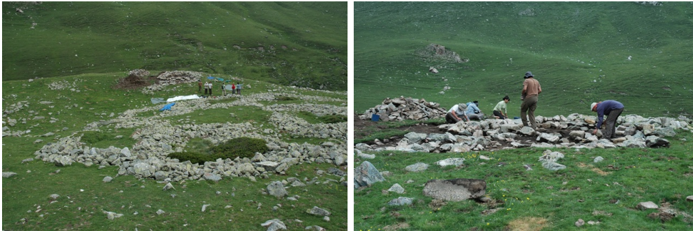
Més imatges de la cabana romana de Coma de Vaca.