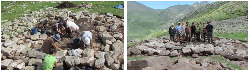
Excavació a la cabana romana de Coma de Vaca, i imatge del grup dins de la cabana.

Totes són antigues! La més moderna és anterior a l'any 1000, o sigui que hem encertat els sondejors. Sumat a altres datacions dels anys 2011 i 2012, en total tenim 25 nivells arqueològics documentats, corresponents a diferents estructures. És una franja cronològica molt interessant.