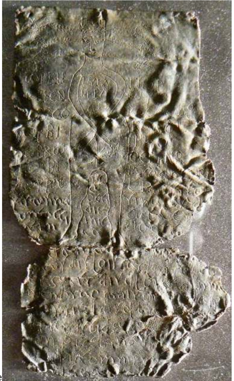
Tauleta del segle V dC en grec i llatí amb el dibuix de la divinitat infernal Hècate, conservada al Museo civico archeologico (Bolonya).

El mort no ha de tornar. També als nens se'ls posaven pedres, al pit o als ulls, perquè si morien abans d'hora podien tornar i no convenia. Encara que la persona fos molt estimada, havia d'estar ben enterrada. Els morts no es poden tocar, la religió ja ho procura, i d'aquí tota la ritualitat al voltant del mort.