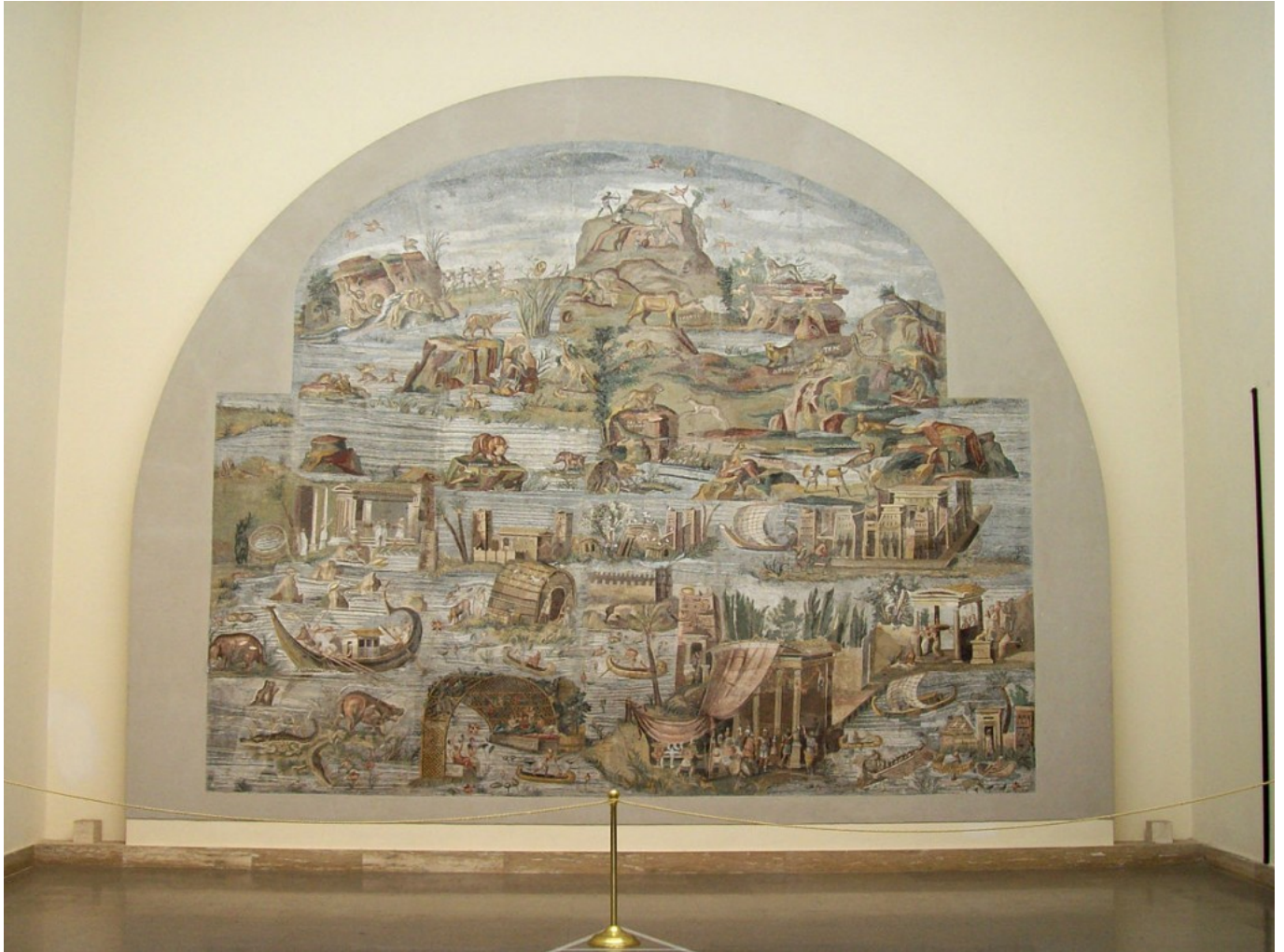
Mosaic de Palestrina

El gest públic que s'observa a l' estàtua d'Afrodita Cnidia troba un antecedent en determinades figuretes nues d'Hathor (una de les quals, mecànica, es pot veure al Metropolitan Museum de Nova York - MMA 58.36 ).