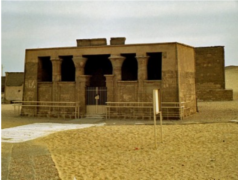
Tomba de Petosiris