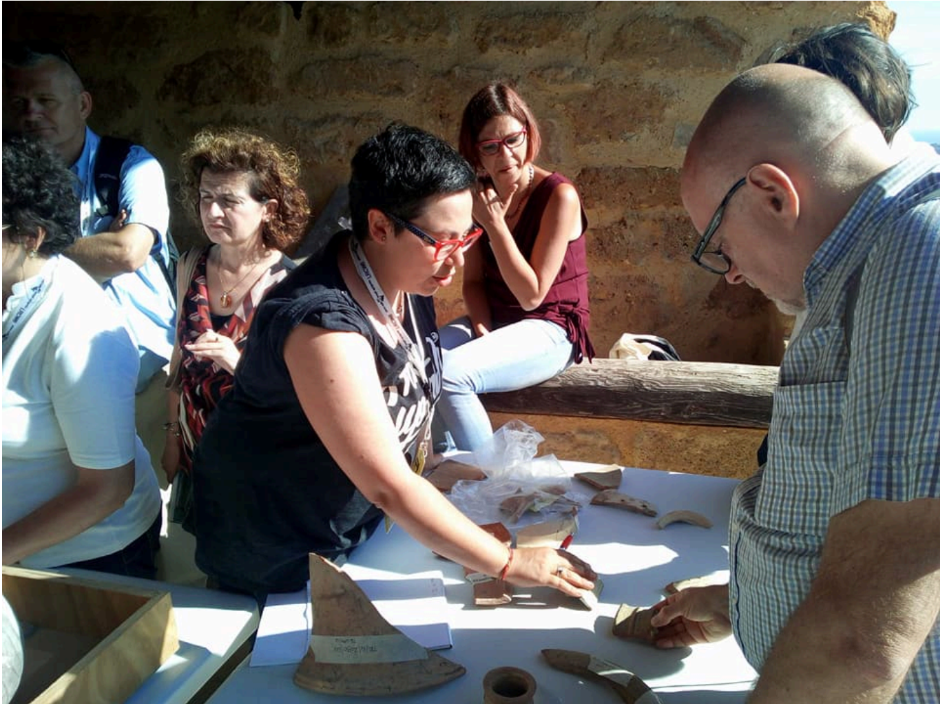
Una activitat de la 6a edició del congrés LRCW (Agrigent, Itàlia)