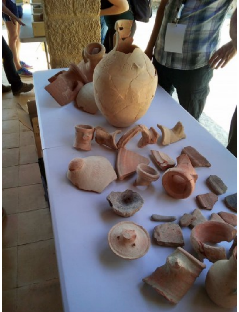
LRCW6 (Agrigent, Itàlia)

Cada sessió serà introduïda per una presentació de 30 minuts a càrrec d'un ponent convidat i seguirà amb les comunicacions orals. Hi haurà sessions de pòsters i tallers o seminaris amb mostres de ceràmiques.