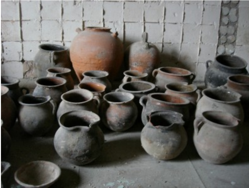
Mostra de ceràmiques de la Casa de la Convalescència de Vic.

Concretament, en la tesi es consideren ceràmiques amb decoracions marrons de ferro i de manganès, amb particular atenció a ceràmica de tipus à taches noires de la localitat provençal de Jouques i ceràmica comuna procedent de les intervencions arqueològiques fetes a la Casa de Convalescència de Vic.