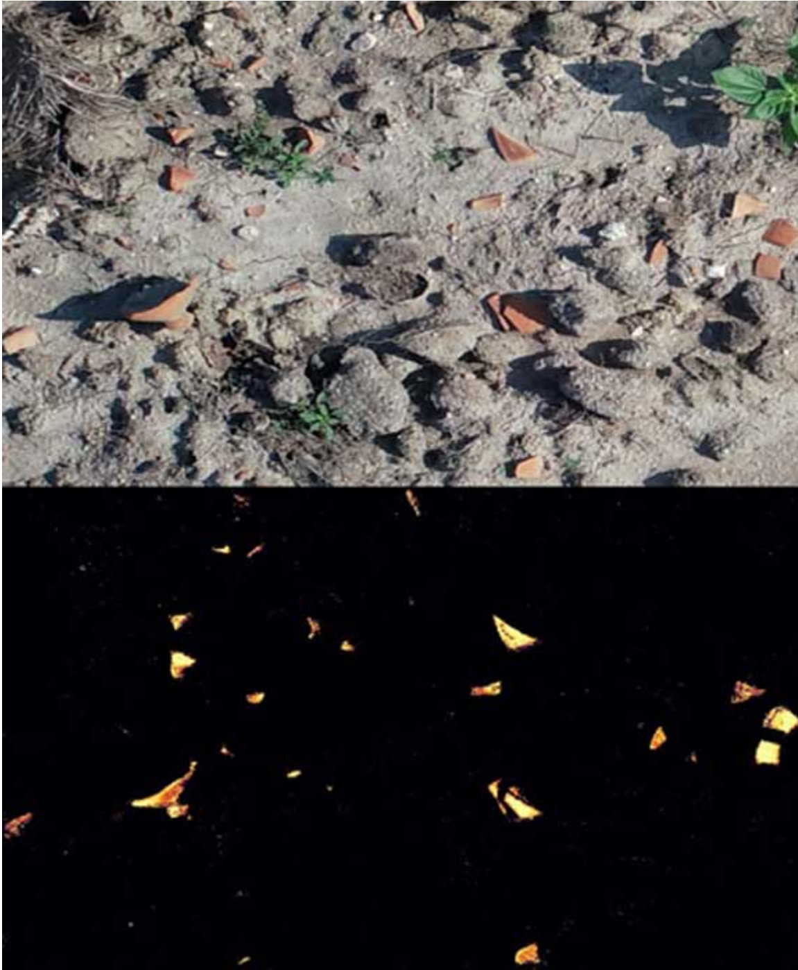
Imatge superior que mostra una imatge captada per drons. Imatge inferior que mostra les peces detectades per l'algorisme d'aprenentatge automàtic (Arnau Garcia-Molsosa i Hector A. Orengo)