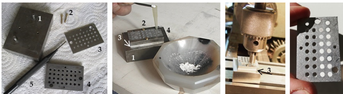
Seqüència de la preparació de mostres per a l'anàlisi CL-quantitatiu, desenvolupada per Ph. Blanc a la UPMC de París

El nou mètode consisteix en la preparació de mostres del marbre en pols, que tot seguit es col·loquen en una placa específicament dissenyada per a poder ser premsada i introduïda al microscopi electrònic de rastreig (SEM) amb un espectròmetre acoblat. Així, es poden obtenir els espectres específics i la intensitat d'aquests espectres per a cadascuna de les mostres.