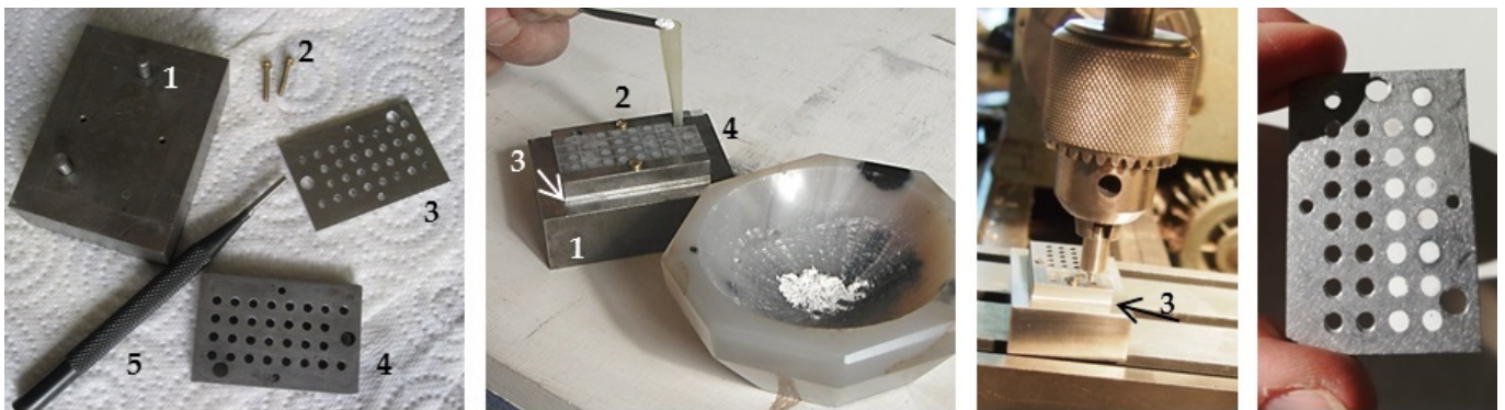
Seqüència de la preparació de mostres per a l'anàlisi CL-quantitatiu, desenvolupada per Ph. Blanc a la UPMC de París

El nou mètode consisteix en la preparació de mostres del marbre en pols, que tot seguit es col·loquen en una placa específicament dissenyada per a poder ser premsada i introduïda al microscopi electrònic de rastreig (SEM) amb un espectròmetre acoblat. Així, es poden obtenir els espectres específics i la intensitat d'aquests espectres per a cadascuna de les mostres.