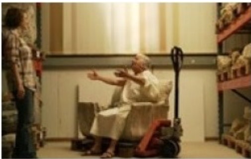
El fantasma de palau (VO FR / VS CAST, 23')

Què passaria si una jove arqueòloga es trobés amb un fantasma del passat, un romà que pogués transmetre en primera persona com es vivia fa dos mil anys a la ciutat d'Aventicum (Suïssa)? S'establiria un apassionant diàleg per a parlar dels principals monuments de la ciutat, les restes epigràfiques, els mosaics o les termes.