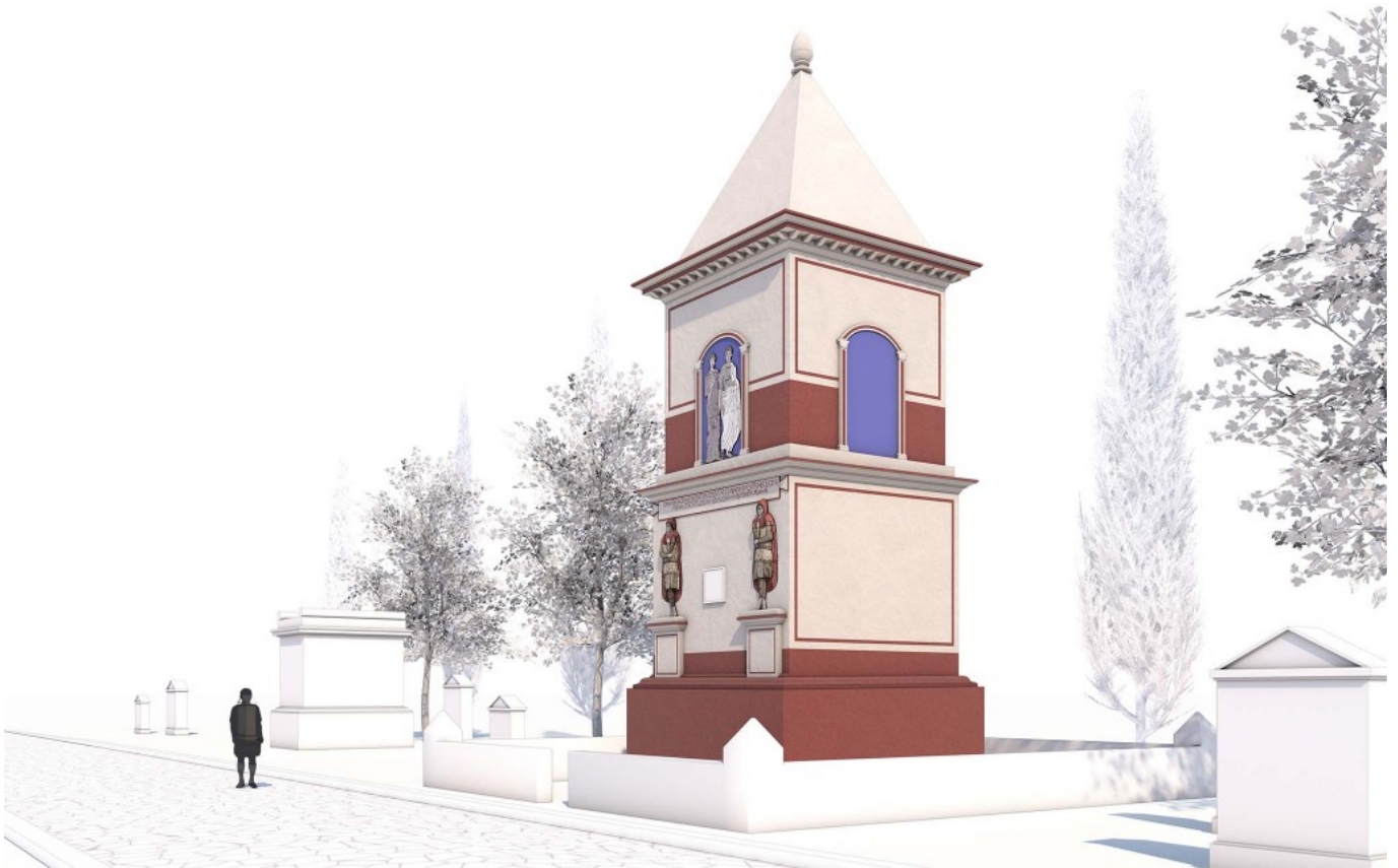
Torre dels Escipions @ SETOPANT

Punts d'interès: Arquitectura, Atis , Inscripció monumental, Inscripció desapareguda, Baix relleu.