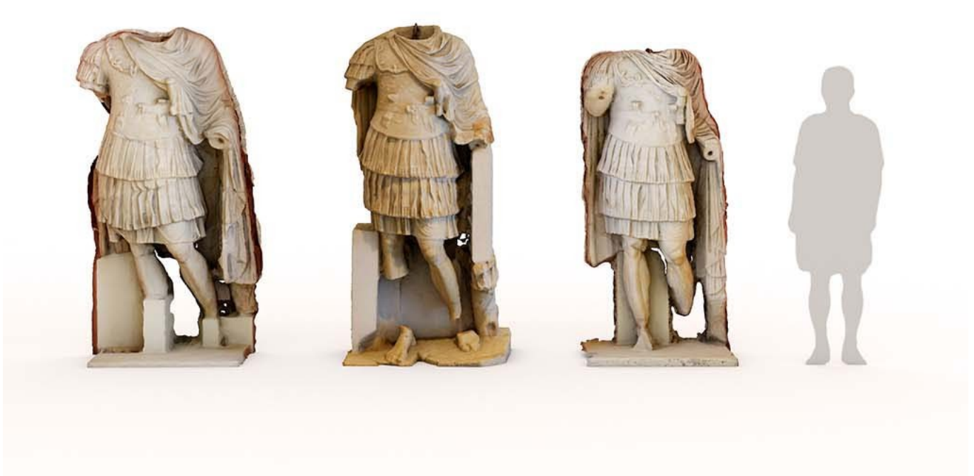
Conjunt d'escultures recuperades de l'entorn del Teatre

Punts d'interès: Altar dedicat al culte imperial, Marmorització, Cicles escultòrics, Façana posterior, Façana escènica, Elements arquitectònics, Nimfeu, Tribunes, Murs radials, Restes conservades, Velum.