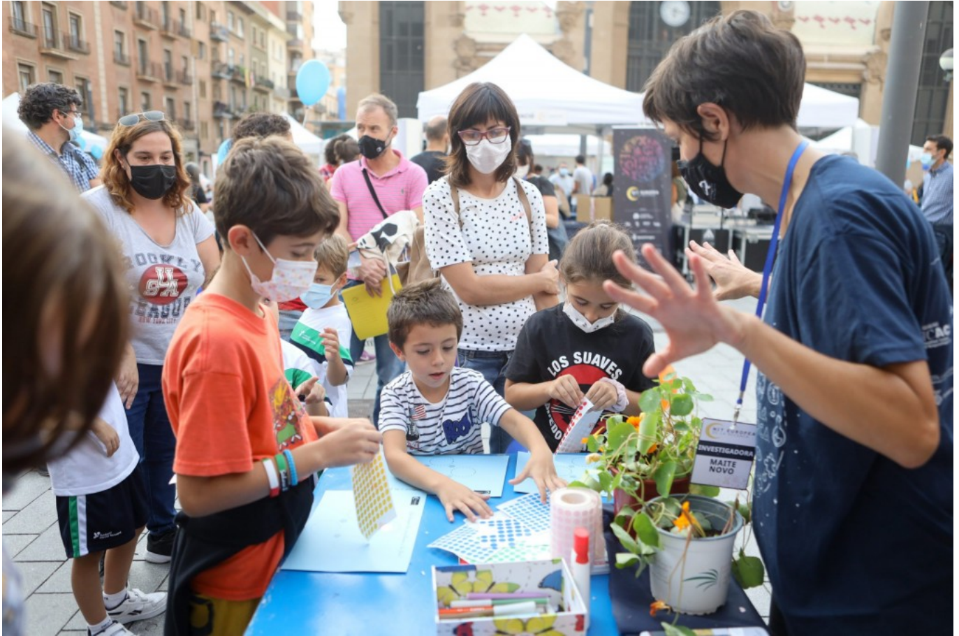
Imatge de la plaça Corsini durant la celebració de la Nit Europea de la Recerca 2021.