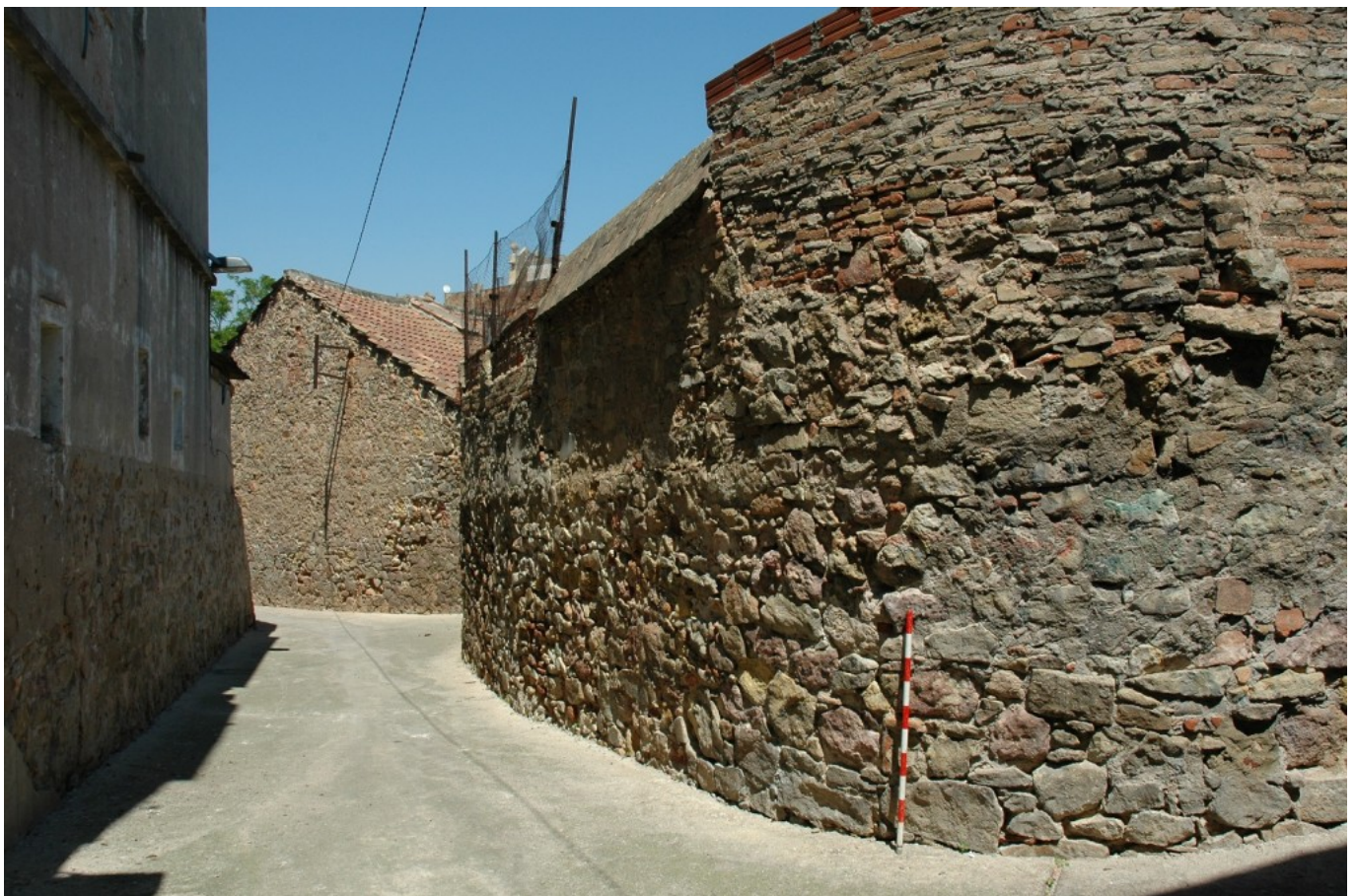
La Satalia, passatge antic de València.

El treball va permetre proposar l' emplaçament exacte de l'església de Sant Julià , una important parròquia altmedieval actualment desapareguda situada a la muntanya de Montjuïc, i identificar diverses pedreres, com les que hi ha als jardins del Palauet Albéniz o la de Laribal, als jardins del mateix nom. El front de la pedrera Machinet, al Teatre Grec, és el més conegut en aquest sector de la muntanya, ja que es va aprofitar com a front escènic del teatre.