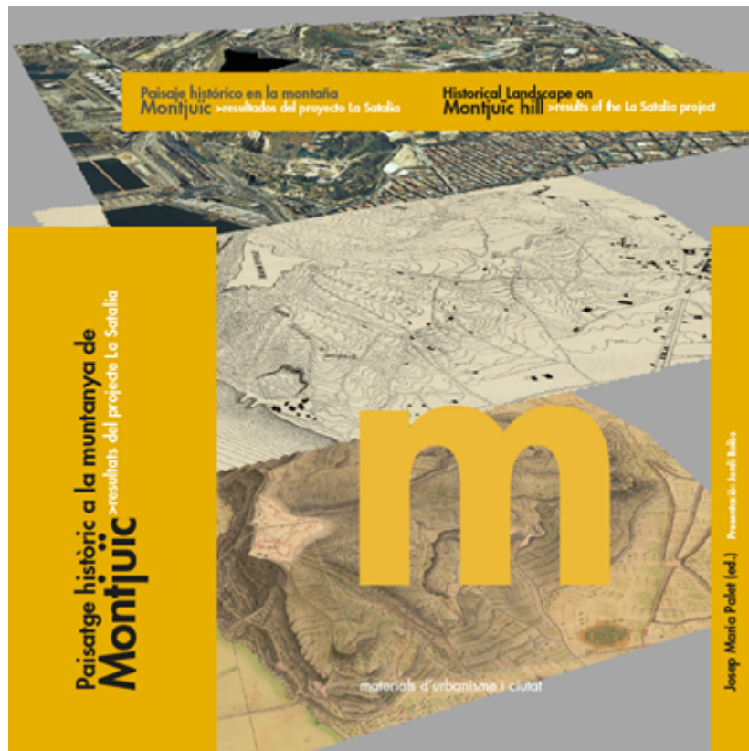
Coberta de la publicació

Montjuïc forma part integral de la història de Barcelona