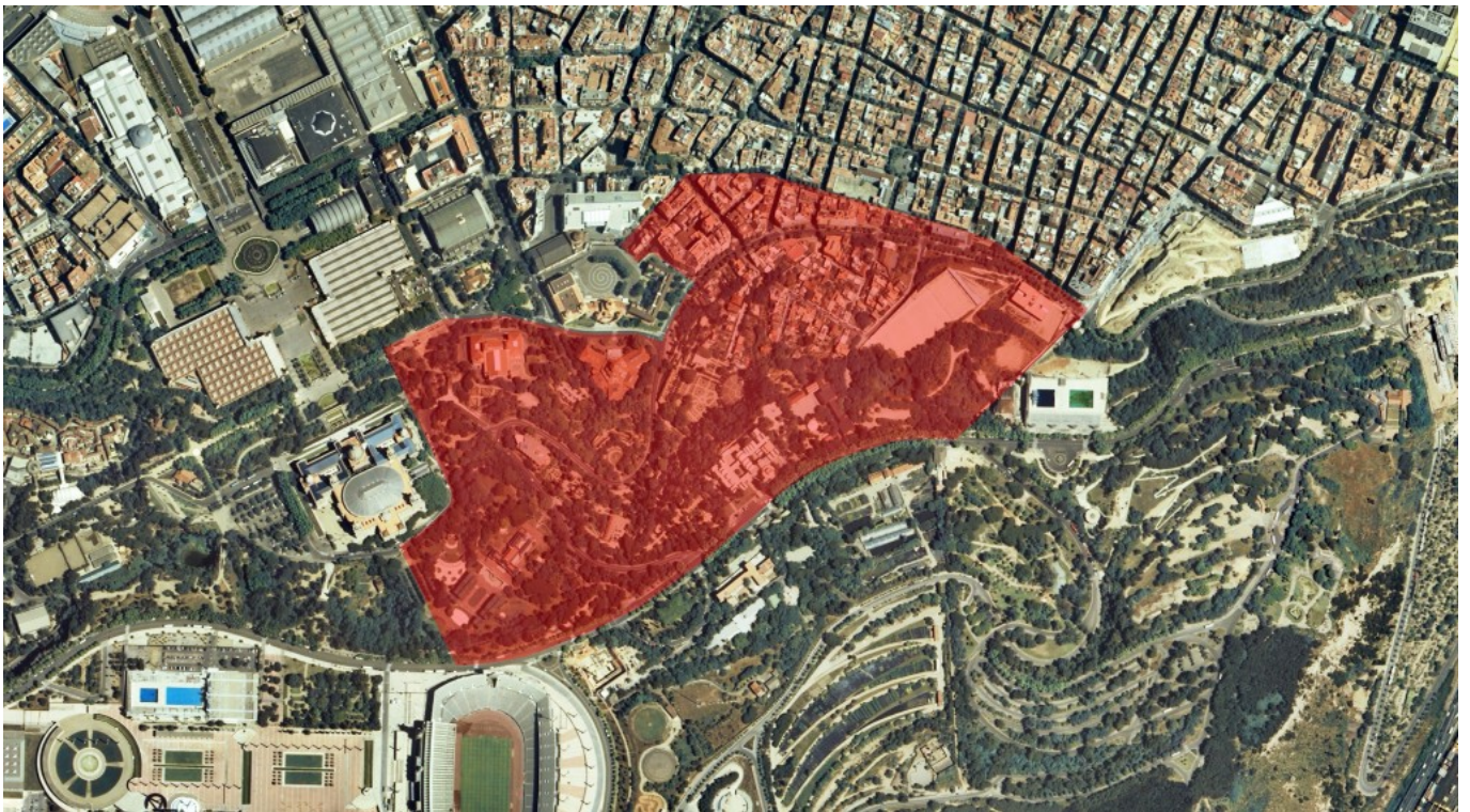
Delimitació de la zona estudiada sobre el terreny.

El llibre ofereix material gràfic inèdit amb reconstruccions històriques molt ajustades a l'estat de la recerca per a les fases romana, tardoromana i medieval. A més, es presenta en tres llengües —català, castellà i anglès— i en format digital, que es pot descarregar gratuïtament ( aquí i al repositori obert de l'Ajuntament de Barcelona ).