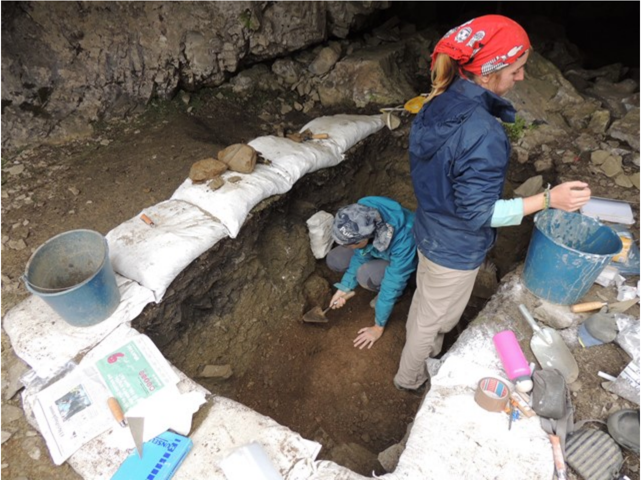
Treballs geoarqueològics a la cova prehistòrica del Catau de l'Os, al Forat de l'Embut (Queralbs, Ripollès). Foto: ICAC, 2017.