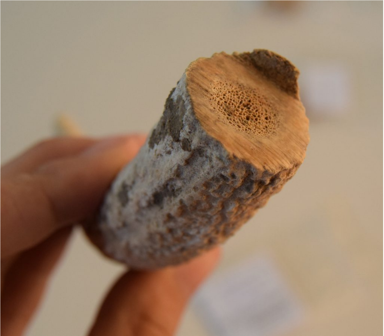
Detall d'una banya de cérvol de Mas Castellar de Pontós, amb marques de serrat i flexió.