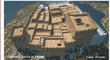
Castellot ibèric de Calafell

Les fortificacions urbanes preromanes a la Mediterrània occidental: origen, funcions i evolució estructural (Homenatge a Henri Tréziny)