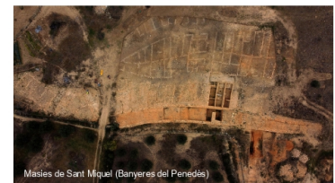
Masies de Sant Miquel (Banyeres del Penedès)