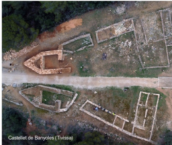
Castellot de Banyoles (Tivissa)