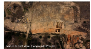
Masies de Sant Miquel (Banyeres del Penedès)