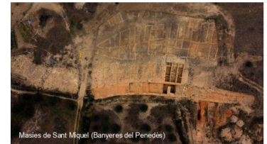
Masies de Sant Miquel (Banyeres del Penedès)