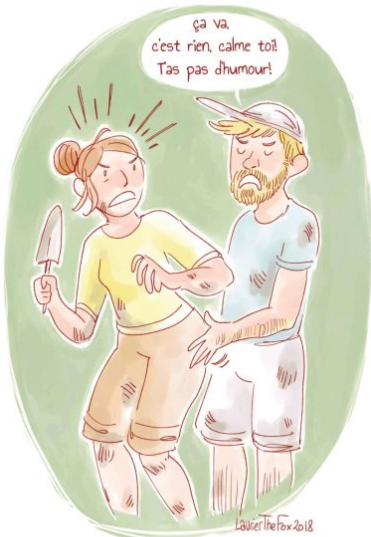
Una de les imatges de la mostra “Arqueosexisme”. Il·lustració de Laurier the Fox.

“Em va posar la mà al cul. Li vaig dir que no ho tornés a fer i em va contestar: