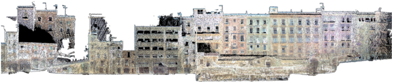
Reconstrucció tridimensional del carrer del Trinquet Vell (Tarragona).

Més informació sobre la publicació aquí .