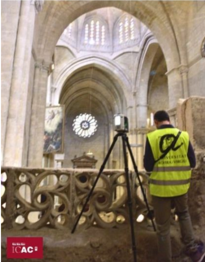
catedral maig 2024 (2) - 1