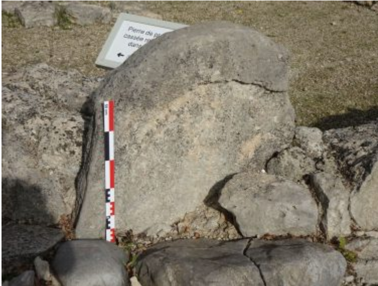
Peu de premsa reaprofitat en un mur de l'îlot 8 a l'oppidum d'Entremont (Aix-en-Provence, Bouches-du-Rhône).