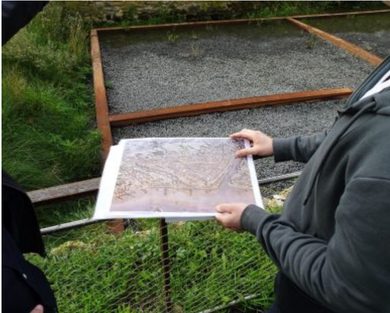
Visita a les restes arqueològiques de Lattara (Musée Henri Prades, Lattes, Hérault).

Aquesta estada de recerca és possible gràcies a una ajuda de mobilitat del Ministeri de Ciència, Innovació i Universitats , destinada a investigadors del programa FPU per complementar la seva formació acadèmica.