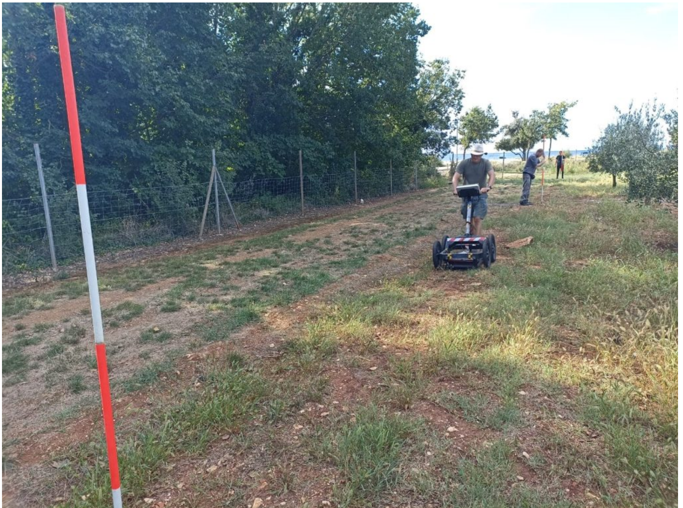
Imatge de la prospecció duta a terme per l'equip del projecte ELRI el setembre de 2023.