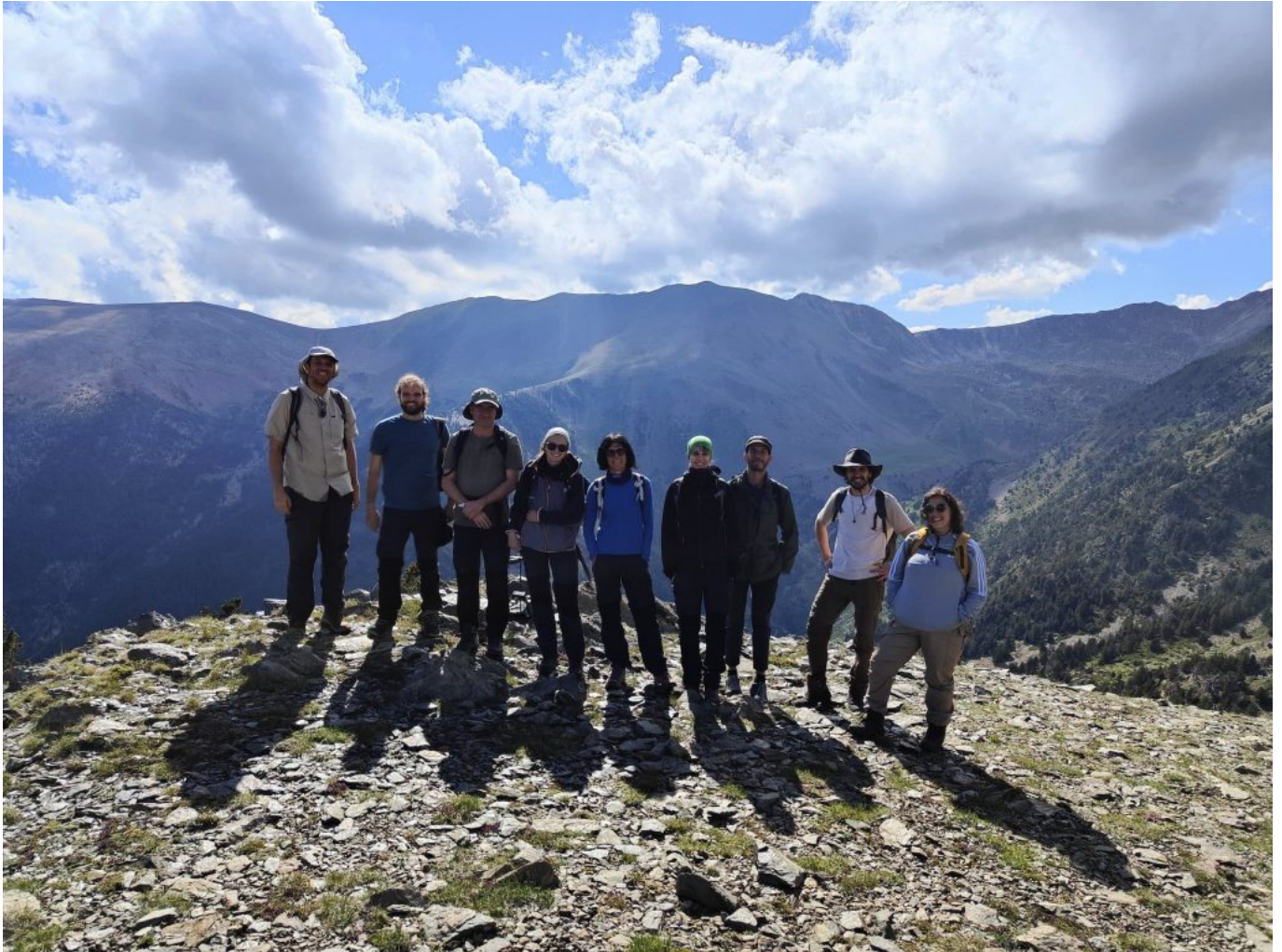
Un grup de membres del GIAP està excavant al jaciment de Coll de Molleres I des del diumenge 7 de juliol.

L'ICAC-CERCA col·labora amb aquesta i altres entitats del territori per garantir la transferència de coneixement de la seva recerca i la posada en valor del patrimoni del paisatge cultural, especialment a través del projecte europeu Inerreg Sudoe Cultur-Monts , que aspira a ser un recurs per al desenvolupament territorial sostenible i el turisme.