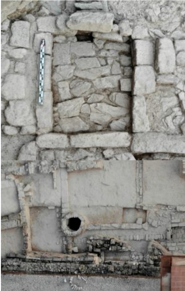
Imatge aèria de Iesso, 2021.