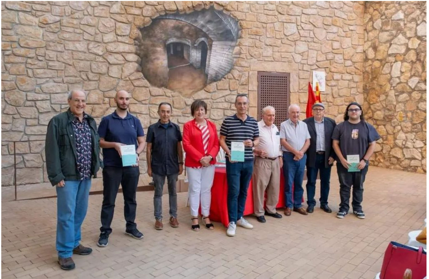
Diversos membres de l'Ajuntament de Constantí i el Centre d'Estudis de Constantí, coeditors de la revista, van acompanyar l'alcalde i Josep M. Macias en la presentació del nou volum.