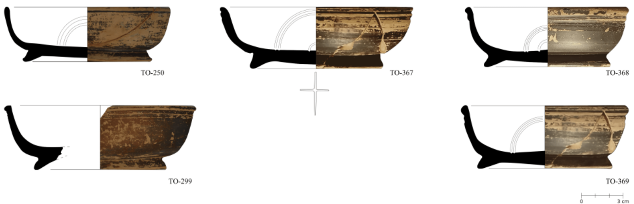
Figura 41. Cuencos de Lamb. 1 / F2320, 2361 de ceràmica campaniense B calena en su fase tardía.

Per a més informació, poseu-vos en contacte amb Publicacions ICAC a través del nostre lloc web o seguïu-nos a les xarxes socials (@ICAC_cat / @icac_cat) per a actualitzacions sobre les nostres publicacions.