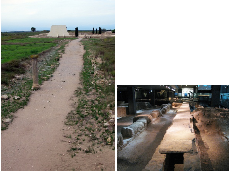
El cardo maximus d'Empúries (esquerra) i la claveguera del decumanus maximus de Valentia, a la zona arqueològica de l'Almoina.

El treball també compara i contrasta els resultats de cadascuna de les ciutats entre ells i amb d'altres casos dins el món romà, la qual cosa ha permès demostrar com una aproximació arqueològica acurada als carrers de la ciutat antiga pot enriquir enormement el seu coneixement, ja que, en definitiva, són una part essencial i indissociable de l'urbs: els seus eixos de comunicació interna i un dels grans escenaris de la vida pública.