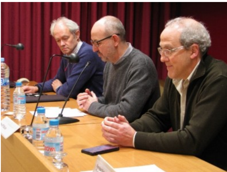
Inauguració del seminari, en el moment de presentar-lo

La investigació s'ha fet gràcies a una doble metodologia, duta a terme a la Part Baixa de Tarragona el novembre del 2015: prospeccions geofísiques i perforacions per llegir la seqüència sedimentològica del port. Els resultats s'han presentat avui a l'ICAC arran del seminari internacional La recerca arqueològica al port romà de Tàrraco .