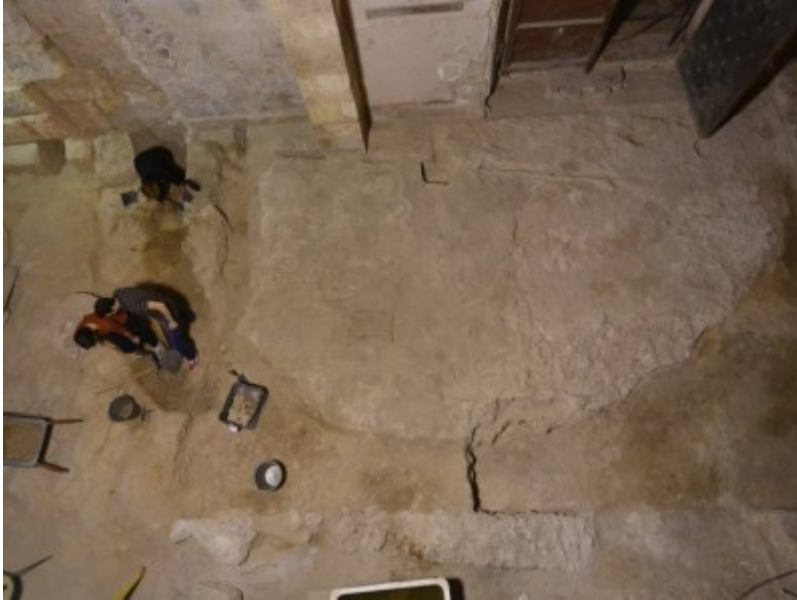
Imatge zenital de l'exedra romana del Claustre de la Catedral de Tarragona.

La iniciativa és una activitat de difusió en el marc dels projectes següents: