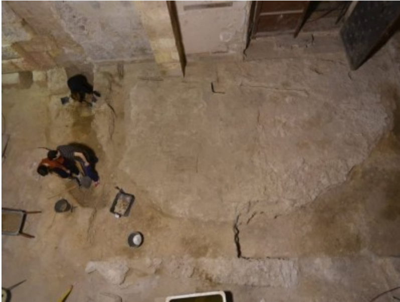
Imatge zenital de l'exedra romana del Claustre de la Catedral de Tarragona.

La iniciativa és una activitat de difusió en el marc dels projectes següents: