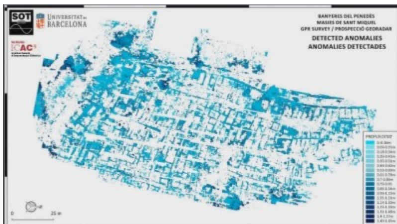
Imatge del vídeo sobre la recerca.

Vídeo de la recerca: El georadar permet veure una gran ciutat ibera soterrada a Banyeres del Penedès