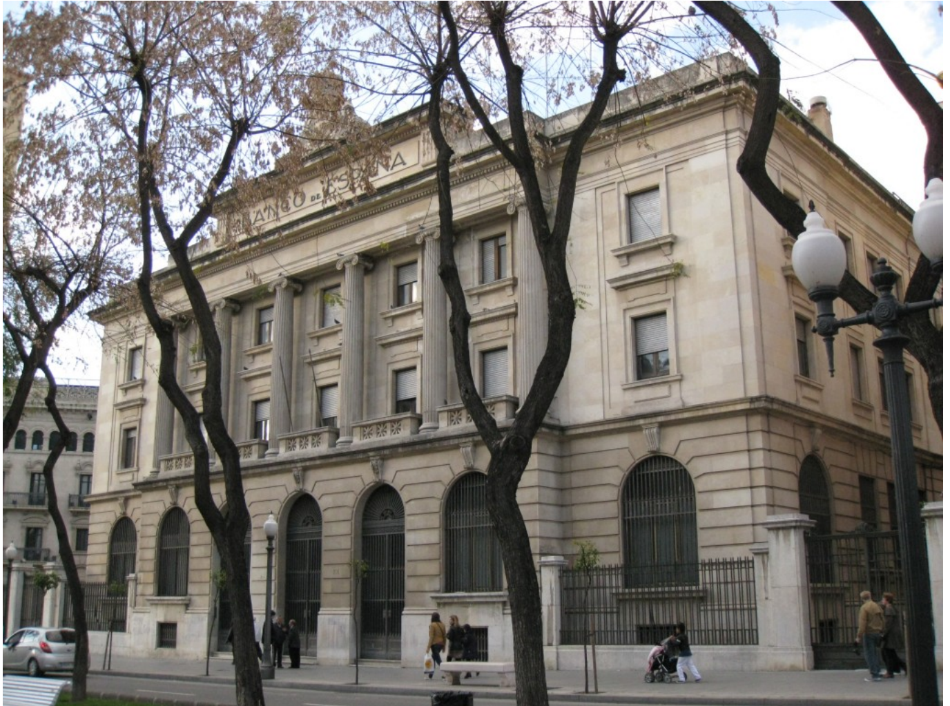
Antic edifici del Banc d'Espanya, Rambla Nova de Tarragona