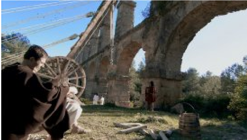
Un moment del documental Acueductos romanos I (...)