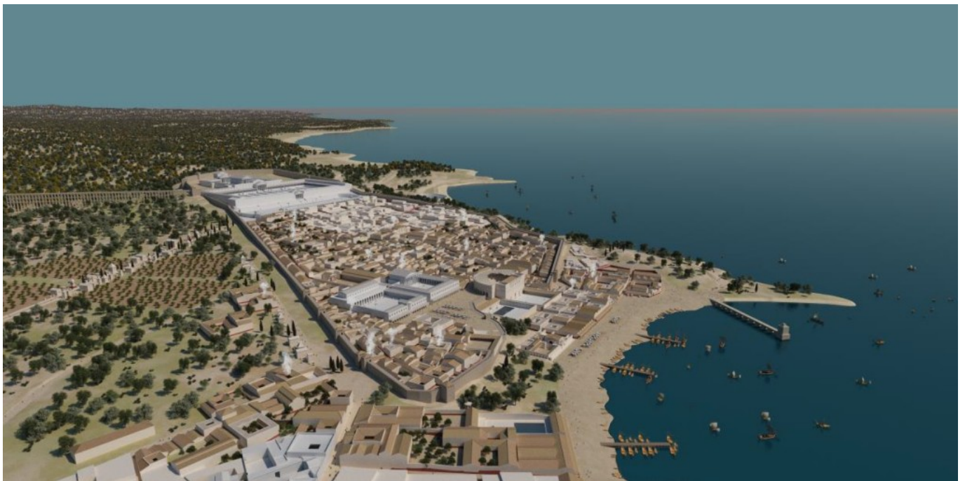
Recreació virtual i en color de la ciutat de Tarraco (fase treball).

L'ICAC, com en edicions anteriors, hi participa en diferents activitats. Enguany ha reforçat el seu paper assessor, amb la col·laboració del grup de recerca SETOPANT (URV-ICAC). La col·laboració ha consistit, fonamentalment, en un treball de recreació virtual del fòrum de Tarraco que s'exposarà en les activitats de divulgació històrica del festival. És una manera d'apropar l'expertesa de l'ICAC i el SETOPANT en l'ús de la realitat virtual per al coneixement i divulgació del patrimoni . En aquest cas, al voltant de l'arquitectura i urbanisme de l'antiga Tarraco .