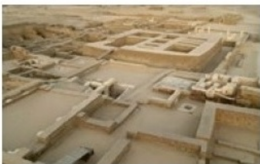
Tebtunis, una ciutat trobada (VO FR / VS CAST, 26')

Què passaria si una jove arqueòloga es trobés amb un fantasma del passat, un romà que pogués transmetre en primera persona com es vivia fa dos mil anys a la ciutat d'Aventicum (Suïssa)? S'establiria un apassionant diàleg per a parlar dels principals monuments de la ciutat, les restes epigràfiques, els mosaics o les termes.