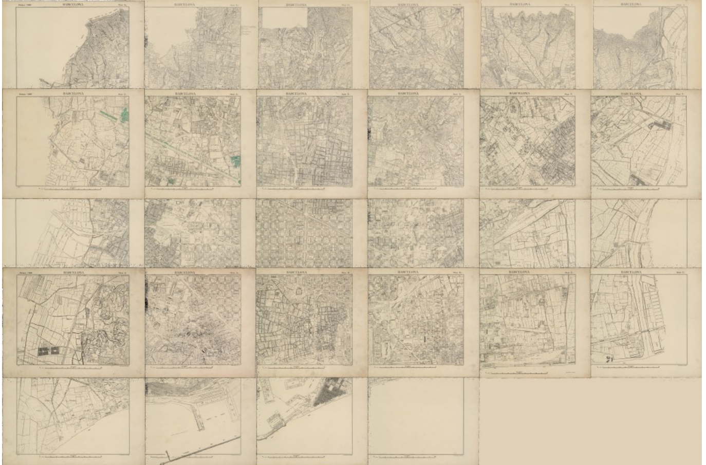
Base cartográfica de V. Martorell de los años treinta georeferenciada.

Se ha desarrollado un trabajo interdisciplinario centrado en aspectos morfológicos, históricos y naturales del paisaje en la ocupación y explotación de la montaña, y su transformación a lo largo del tiempo. En un trabajo de este tipo ha sido importante la incorporación de nuevas tecnologías digitales en el análisis arqueomorfológico , en concreto, Sistemas de Información Geográfica (SIG).