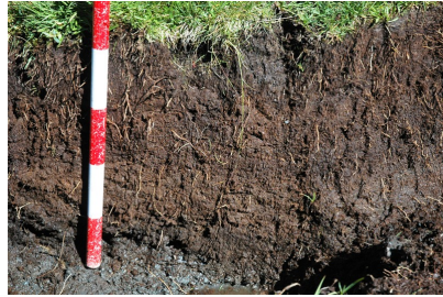
Mostra de torba d'Aigols Podrits (esquerra) i mollera de Coma de Vaca.

Prospecció a la muntanya de Coma de Vaca.