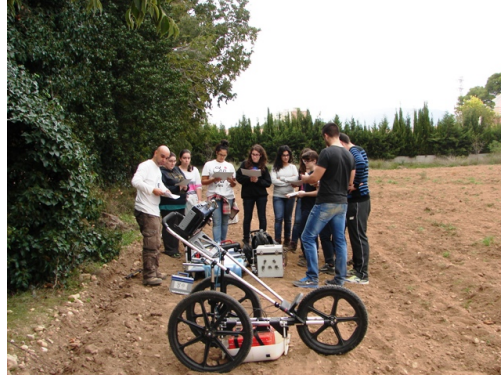
Alumnes que van participar en les prospeccions.

Els alumnes també van col·laborar en la realització de tomografies elèctriques amb el suport de professors i investigadors del Departament de Geoquímica, Petrologia i Prospecció Geològica de la Facultat de Geologia de la UB.