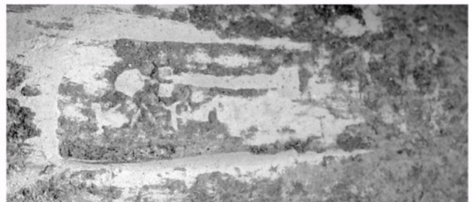
Imatge de la marca ròdia MCT'10.UE-6074.04 (dibuix i foto: Núria Romaní).

És interessant que una de les marques d'àmfora ròdia ha aparegut en un nivell de construcció de l'edifici de Can Tacó. Això ha fet reconsiderar la data inicial del jaciment i situar-lo clarament pels volts del 150 aC, mentre que fins ara se situava en el darrer terç del segle II aC.