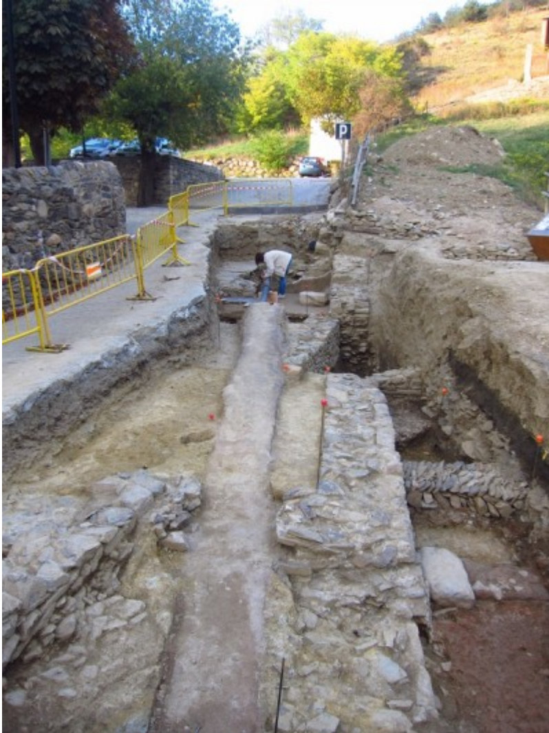
Vista general de l'excavació d'enguany.

Lugdunum Covenarum (Sant Bertran de Comenge), estan situades ja al peu del Pirineu.