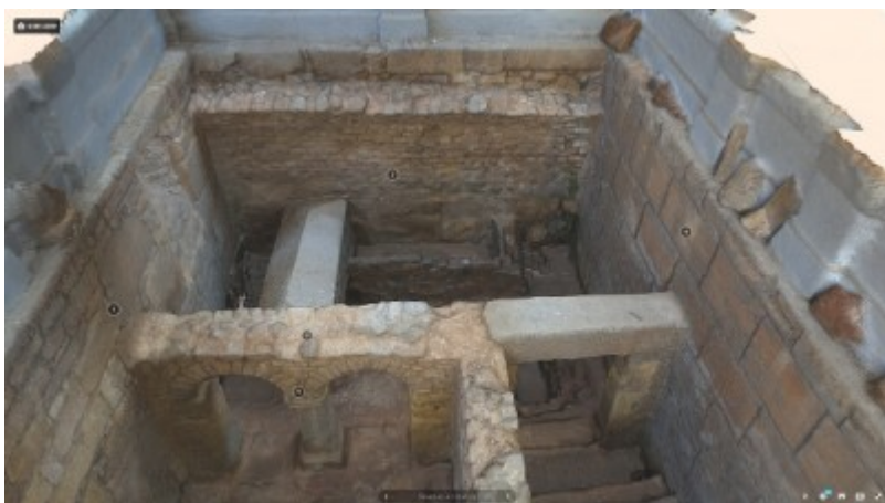
Captura d'imatge del model tridimensional ubicat a Sketchfab.

Gràcies a la plataforma internacional Sketchfab, coneguda com el “youtube dels models 3d”, es pot navegar per models de realitat virtual elaborats per la Unitat de Documentació Gràfica de l'ICAC. D'aquesta manera es poden visitar les restes d'un monument que per diferents motius no sempre ha estat a l'abast de tothom.