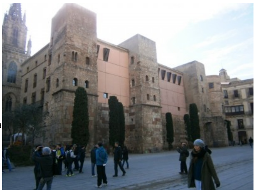
Vista de la muralla de Barcelona.

La finalitat política és fonamental. És propaganda d’una filosofia que el