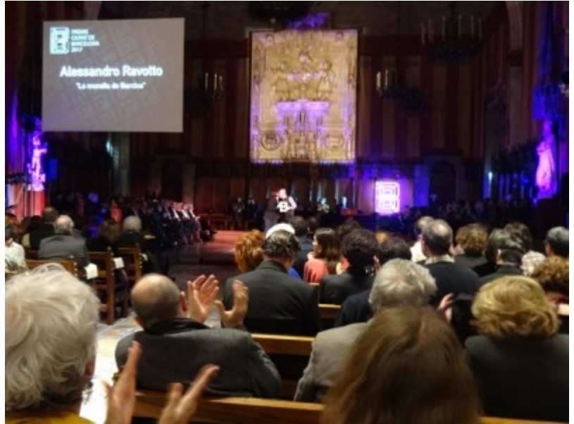
Lliurament del premi Ciutat de Barcelona al Saló de Cent de l’Ajuntament, el 15 de febrer.