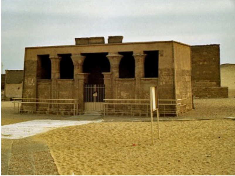
Tumba de Petosiris