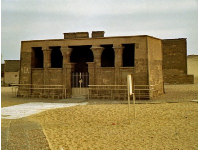
Tumba de Petosiris