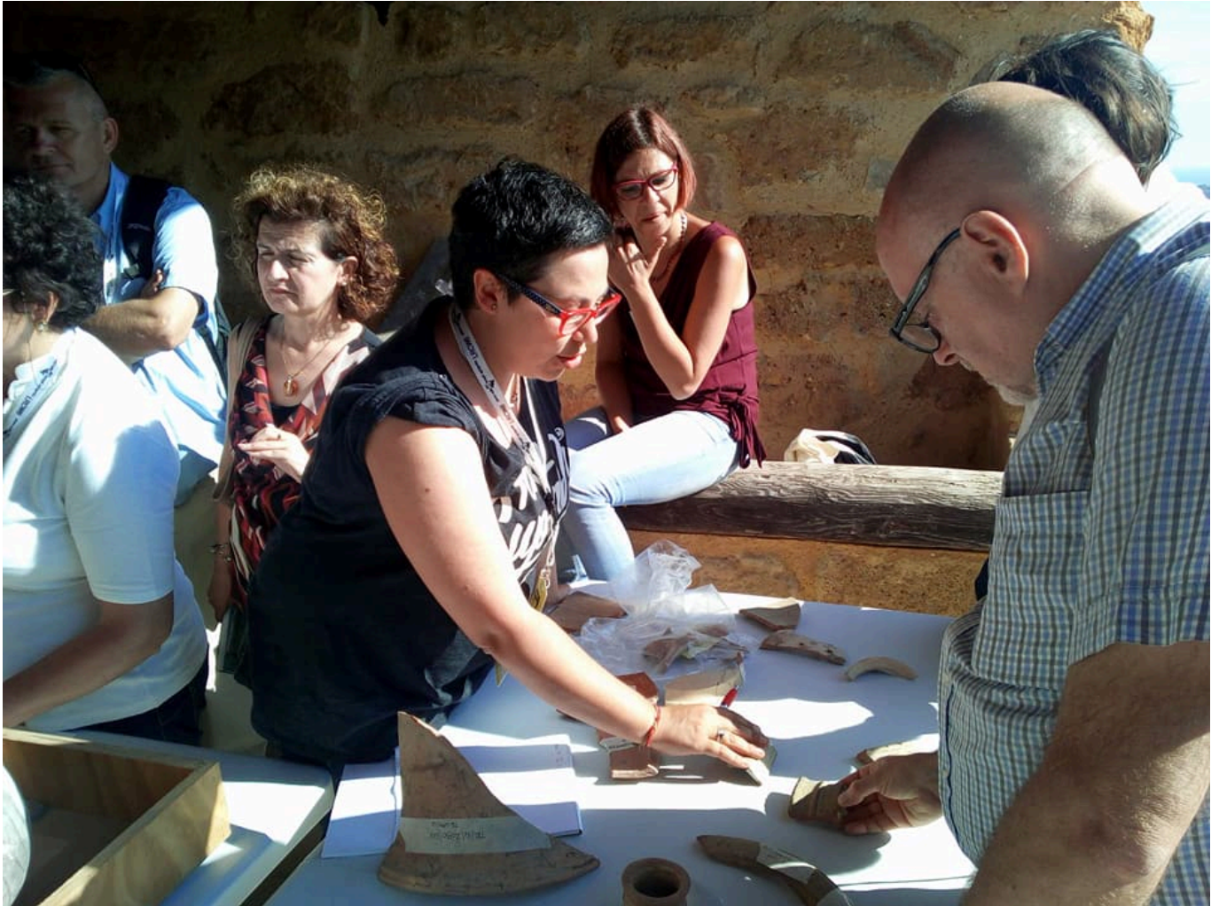
Una actividad de la 6ª edición del congreso LRCW (Agrigento, Italia)