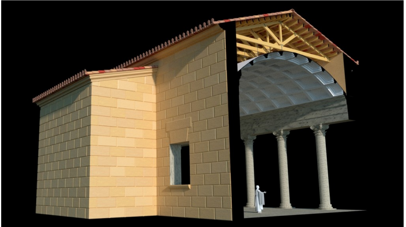
Restitución virtual del espacio actual del Museo Bíblico en época romana con los pórticos y la exedra del recinto de culto imperial (imagen de Silvia Fibla).

Este ejercicio de arquitectura ha permitido tener un nivel de conocimiento mucho más específico sobre cómo era la estructura del edificio. En concreto, se han interpretado las estructuras que se conservan en el interior del Museo Bíblico. El trabajo se ha podido realizar después de que las diferentes excavaciones arqueológicas determinasen que parte de las salas se ubican en el antiguo pórtico del recinto de culto del templo, y que en la sala dedicada a la Judea Romana había una de las exedras -una especie de capilla en forma de ábside en la que los romanos colocaban figuras de los dioses que veneraban- de este conjunto religioso romano.