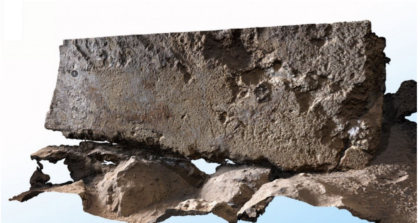
Detalle del modelo 3D de la dedicatoria a Minerva (Torre Minerva), que se considera el epígrafe romano más antiguo de la Península Ibérica.

El proyecto Tarracrópolis es fruto de una larga tradición de colaboración entre el Museo Bíblico Tarraconense y el Instituto Catalán de Arqueología Clásica, que desde hace más de una década trabajan en una línea de investigación y de transferencia del conocimiento conjunta para la comprensión de los fenómenos históricos y urbanísticos en un área de 4 ha del centro histórico de la ciudad actual de Tarragona.