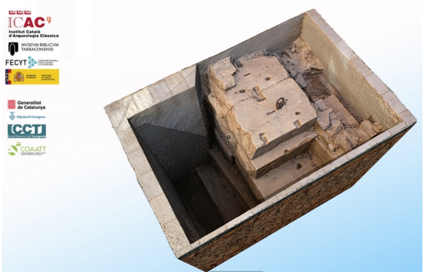
Modelo 3D de los cimientos del muro del recinto de culto imperial.

La nueva colección de modelos tridimensionales es una de las actividades del proyecto “TarrAcro-Polis: un viaje científico de 2.000 años de Historia”, promovido por el Museo Bíblico Tarraconense y el Instituto Catalán de Arqueología Clásica. Es una acción de museografía virtual que sirve de apoyo a la próxima inauguración (el 14 de diciembre) de un espacio de interpretación permanente a las instalaciones del Museo Bíblico Tarraconense.