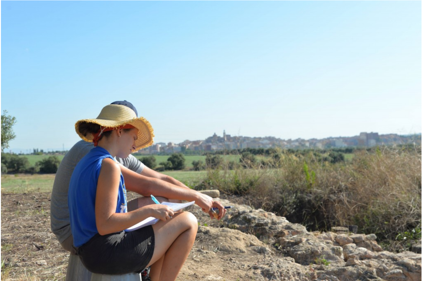
Investigadores en formación trabajando en el yacimiento de Mas dels Frares (2019).

Por otro lado, el máster es también una excelente introducción a la carrera científica, a través del programa de doctorado en Arqueología Clásica (URV-ICAC-UAB) que ofrecen las mismas tres instituciones.