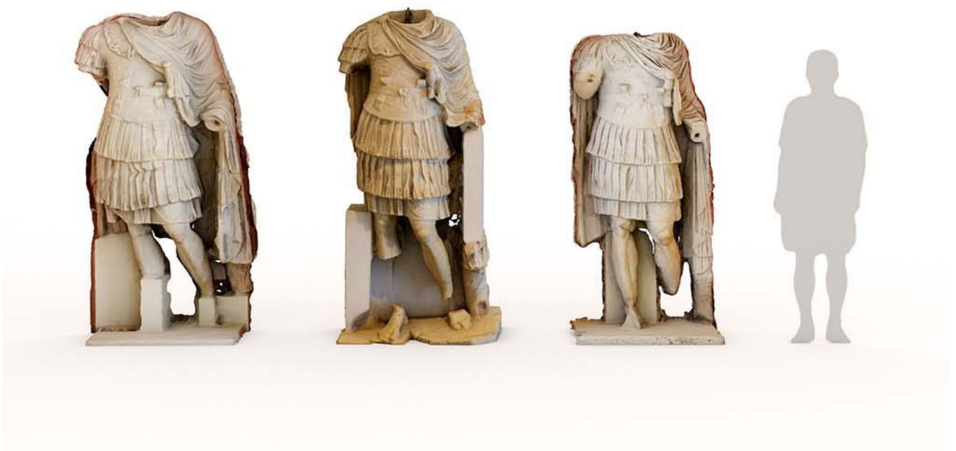
Conjunto de esculturas recuperadas del entorno del Teatro

Puntos de interés: Altar dedicado al culto imperial, Marmolización, Ciclos escultóricos, Fachada posterior, Fachada escénica, Elementos arquitectónicos, Ninfeo, Tribunus, Muros radiales, Restos conservados, Velum.