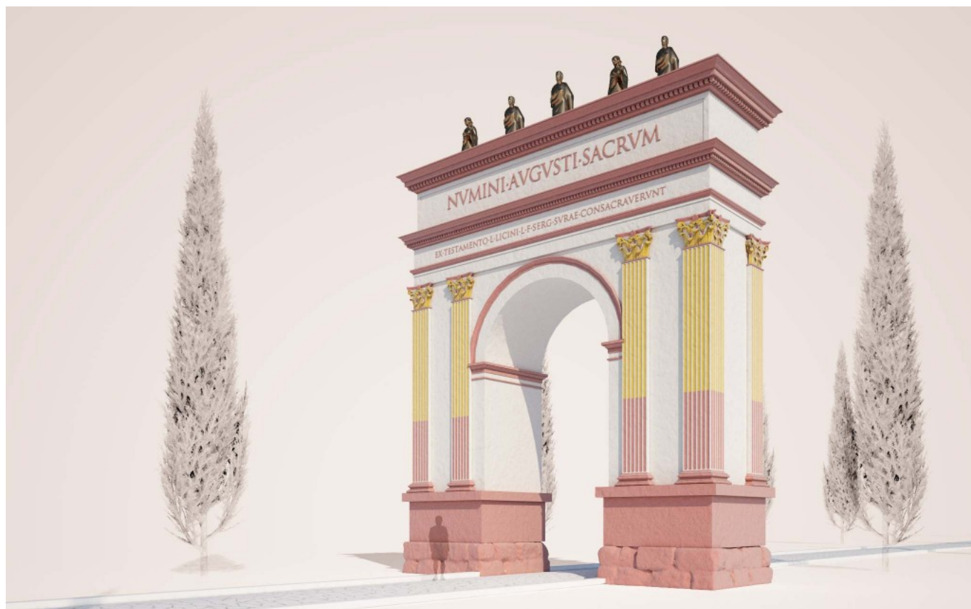
Arco de Berà @ Ferran Gris, Joaquín Ruiz de Arbulo / SETOPANT