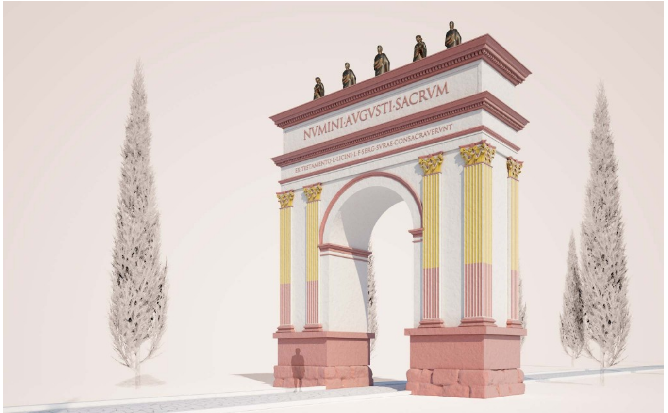
Arco de Berà