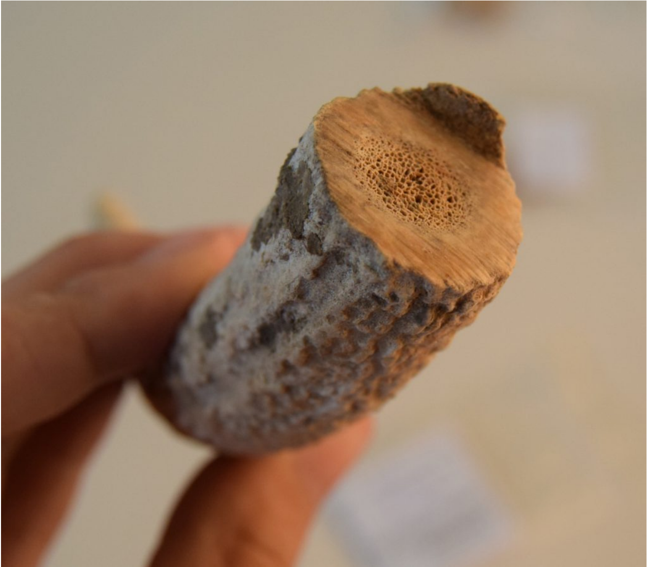
Detalle de un cuerno de ciervo de Mas Castellar de Pontós, con marcas de serrado y flexión.