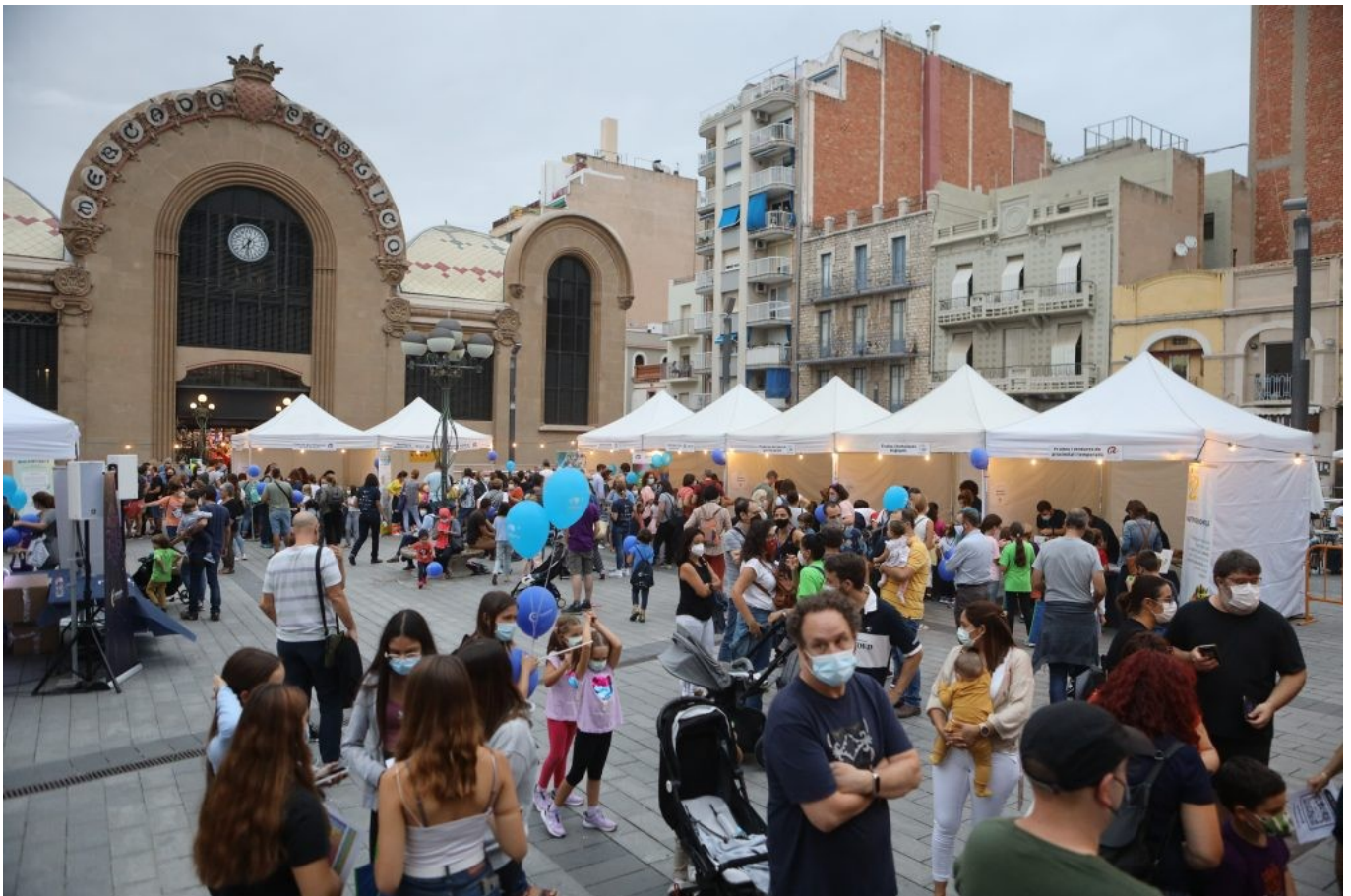
Imagen de la plaza Corsini durante la celebración de la European Researchers Night 2021.

El Ayuntamiento de Tarragona , a través de la oficina Europe Direct Tarragona , es el patrocinador principal de la actividad en la plaza Corsini, junto con la Diputació de Tarragona . También ha contado con la colaboración del Mercado Central de Tarragona y la empresa Borges.