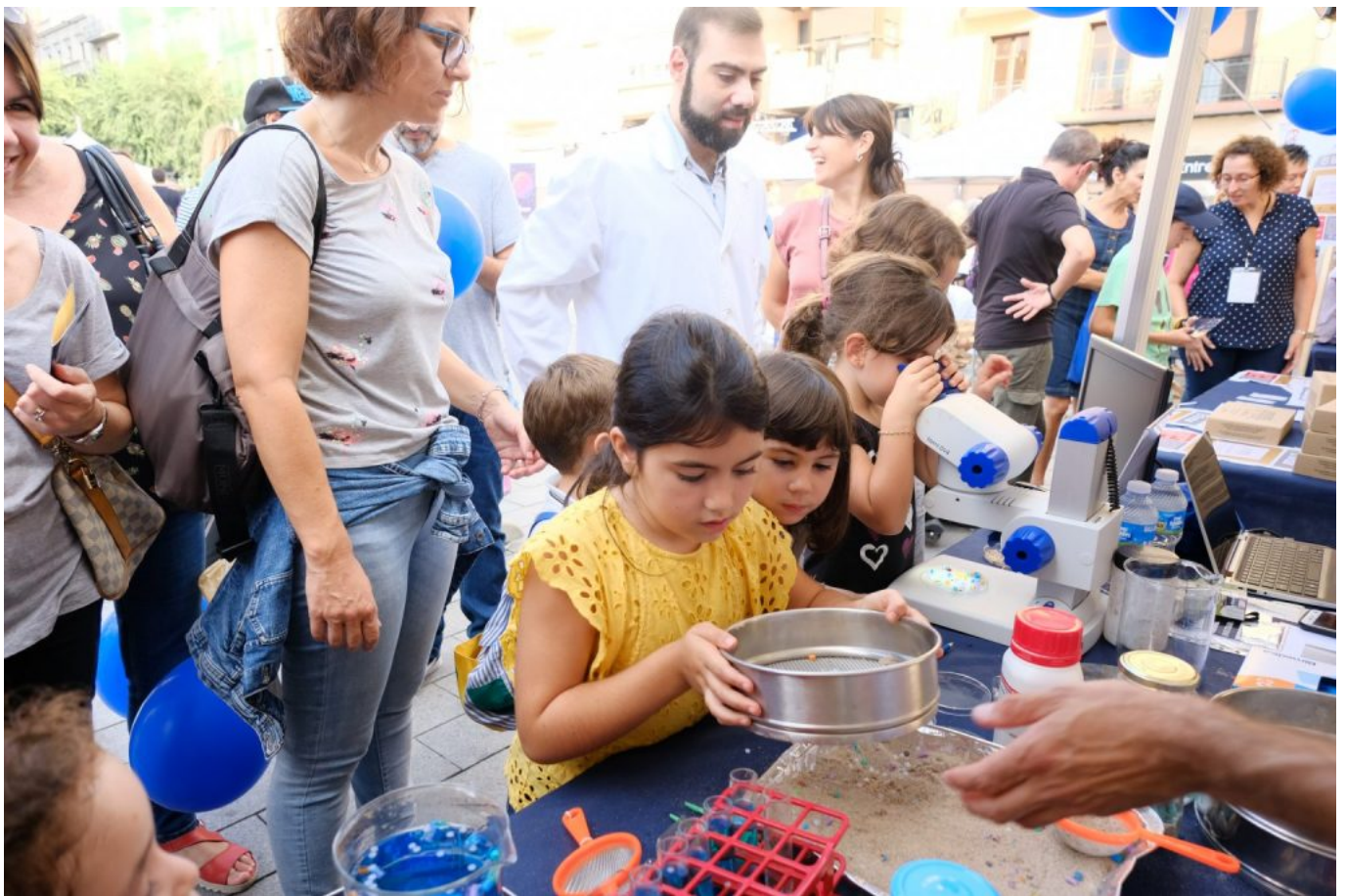
Imagen de uno de los talleres que se hicieron en la edición de 2021.

países del continente. Desde 2018, la URV organiza esta iniciativa en la demarcación de Tarragona, que ha ido creciendo y consolidándose en estos seis años. El objetivo de la Noche Europea de la Investigación es acercar la investigación y sus protagonistas a públicos de todas las edades y dar a conocer la investigación y la innovación en un lenguaje llano y comprensible.