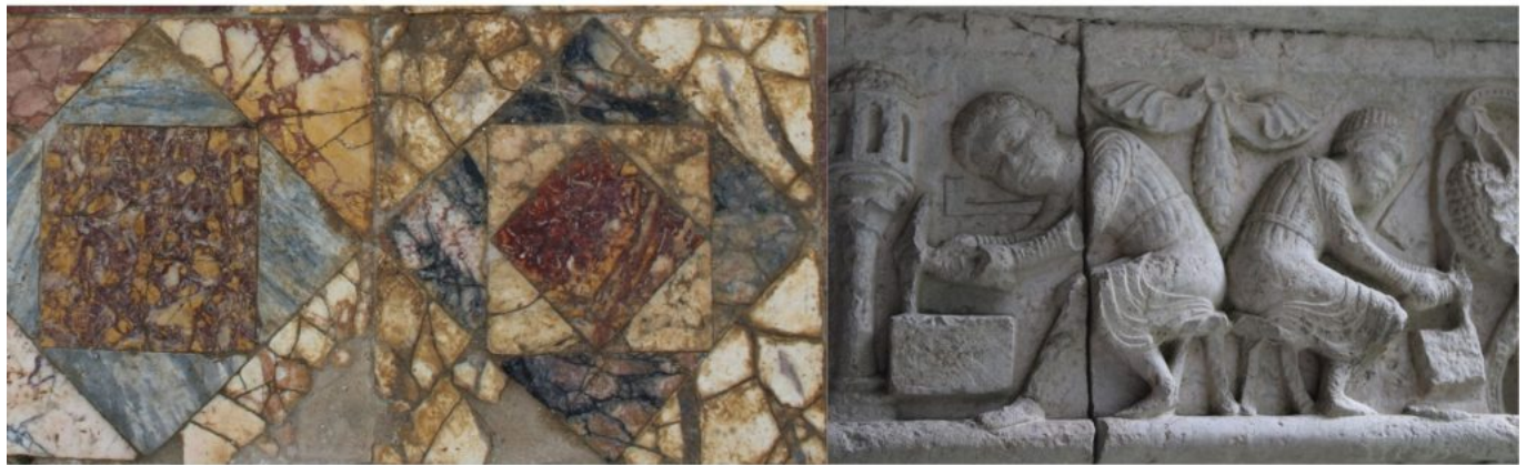
Imagen de la portada de la tesis doctoral de Jordi Oliver (ICAC).