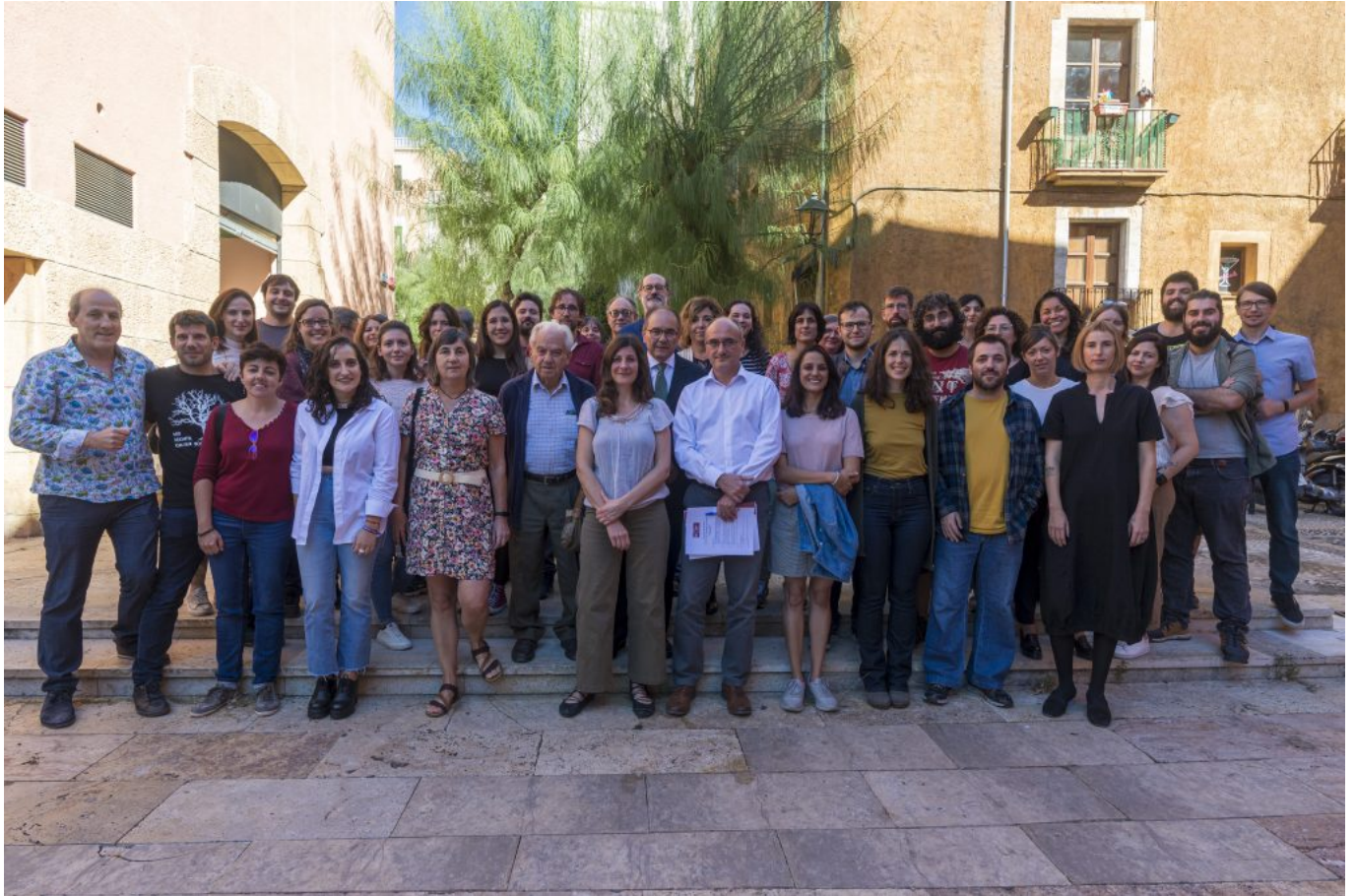
Foto de grupo, el día de la celebración del 20º aniversario del ICAC (octubre de 2022).