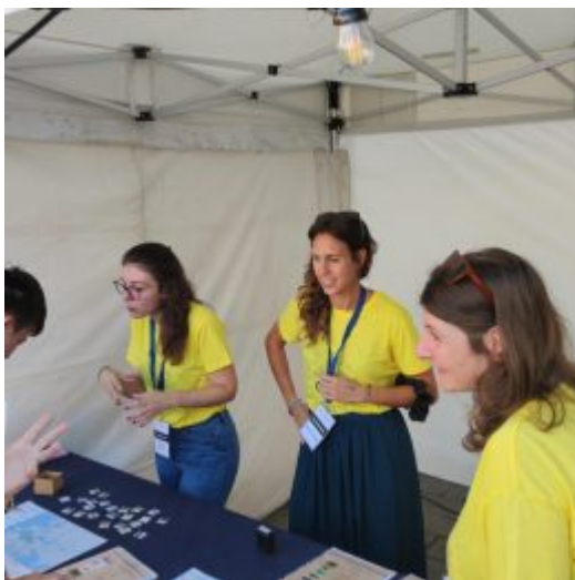
Imatge d'un taller de l'ICAC-CERCA a la fira de tallers de la Nit Europea de la Recerca l'any